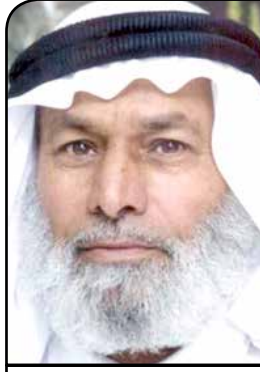
النائب أحمد الحاج علي