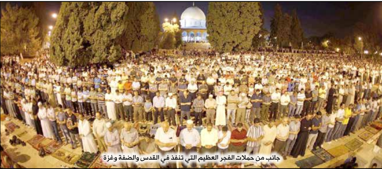
جانب من حملات الفجر العظيم التي تنفذ في القدس والضفة وغزة

أكد نواب المجلس التشريعي بالضفة الغربية المحتلة أن شعبنا بكل أطيافه يرفض التطبيع مع الاحتلال، مشددين على أن صفقة "ترامب" ولدت ميتة وأن مصيرها الفشل، بالإضافة لإشادتهم بحملة