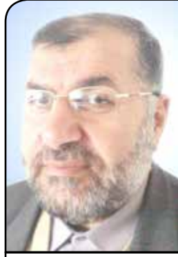
النائب فتحي قرعوي