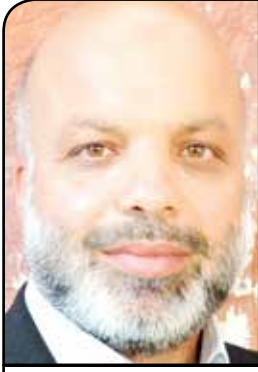
النائب أحمد عطون