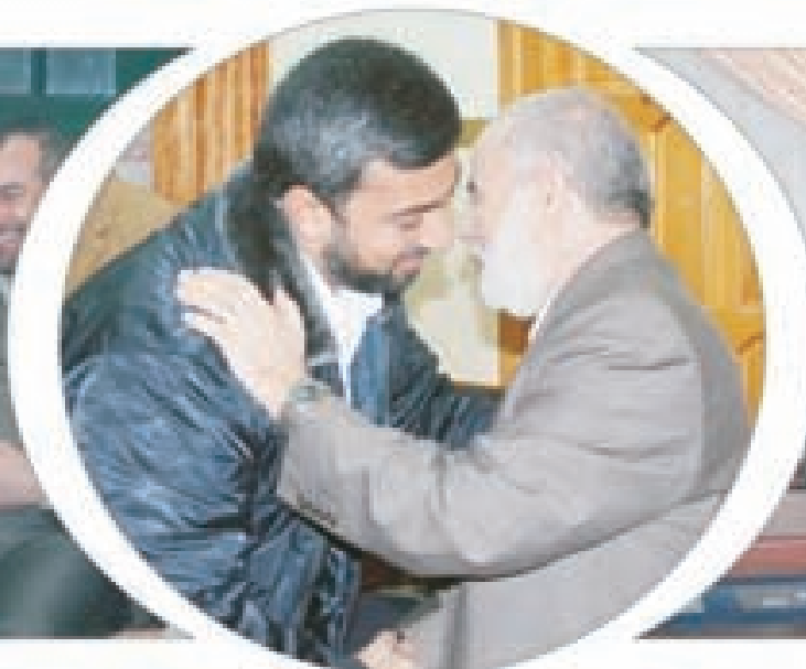
د. بحر يستقبل قائد جهاز الأمن والحماية في محافظات غزة