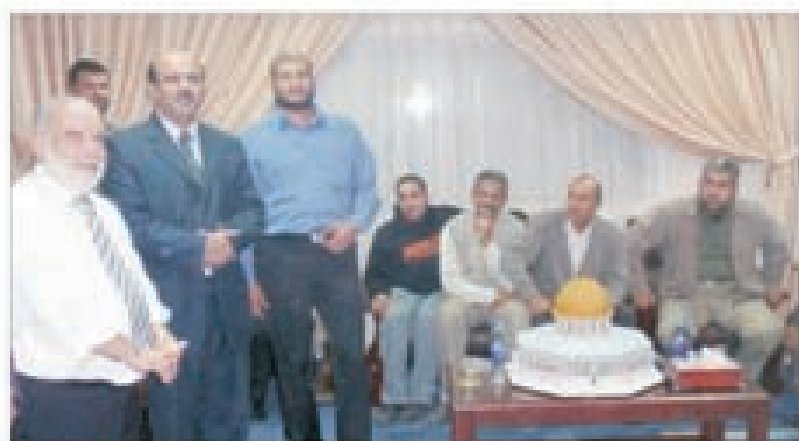
يستقبل موقفي المجلس التشريعي الذين قدموا لتهنئته بحلول عيد الأضحى المبارك