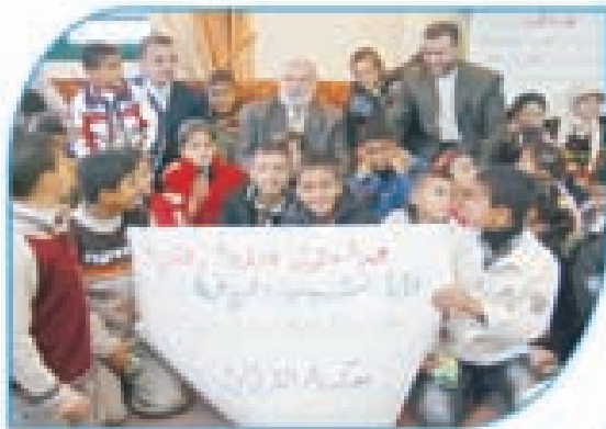
ويحتفل بالعيد مع عدد من أبناء شهداء حرب الفرقان