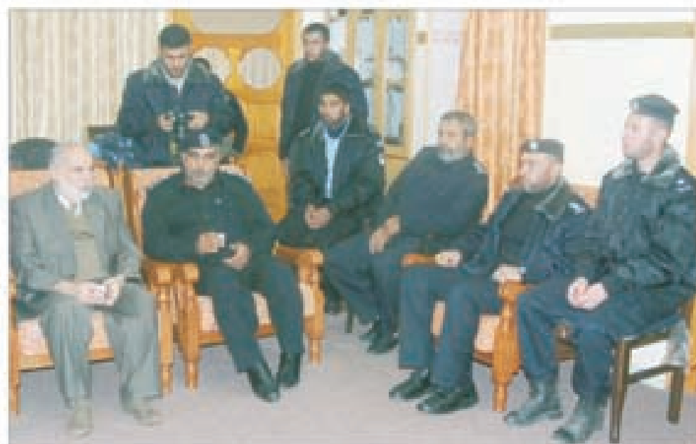
د. بحر يستقبل وفد قيادة جهاز الشرطة في محافظات غزة