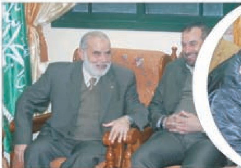
د. بحر يستقبل وفد وزارة الداخلية برئاسة وزير الداخلية والأمن الوطني الأستاذ فتحي حماد