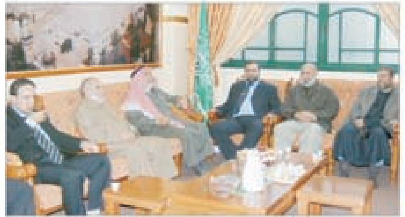
د. بحر يستقبل وفداً من أحد مساجد غزة الدم لتهنئته بالعيد