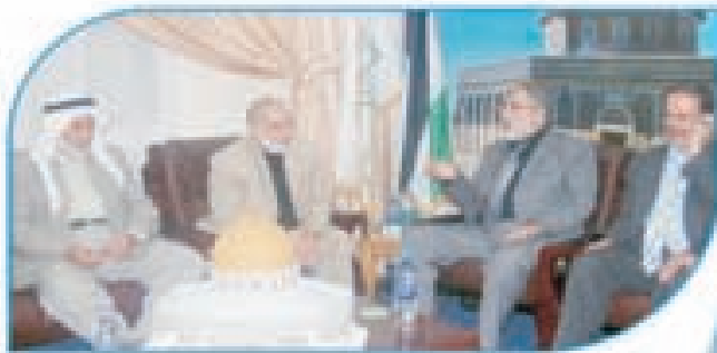
د. بحر يستقبل عدد من النواب