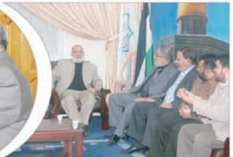
د. بحر وعدد من النواب يستقبلون وفداً من إذاعة صوت الأقصى