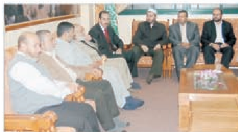
د. بخر يستقبل وفداً من مؤسسة ابداع للاستشارات وعدد من الشخصيات الذين قدموا لتهنئته بالعيد