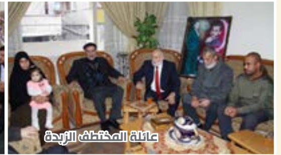
عائلة المختطف الزيد