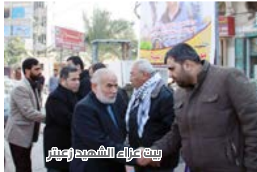
بيت عزاء الشهيد زعيتر