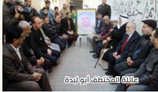
عائلة المختطف أبو لبدعة