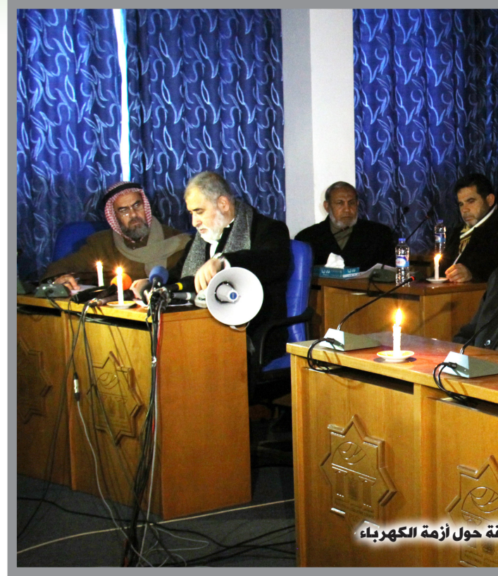
قصة حول أزمة الكهرباء