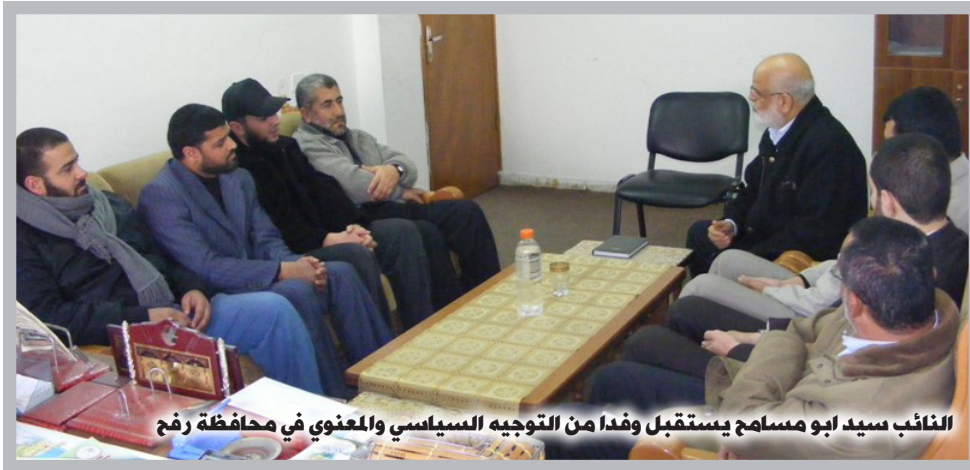
النائب سيد ابو مسامح يستقبل وفدا من التوجيه السياسي والمعنوي في محافظة رفح

وضم وفد النواب كلا من النائب مروان أبو راس والنائب جمال سكيك، وكان في استقباله مدير المديرية محمود أبو حصيرة والنائب الفني والنائب الإداري ولفيف من المعلمين والمعلمات وحشد من الطلاب.