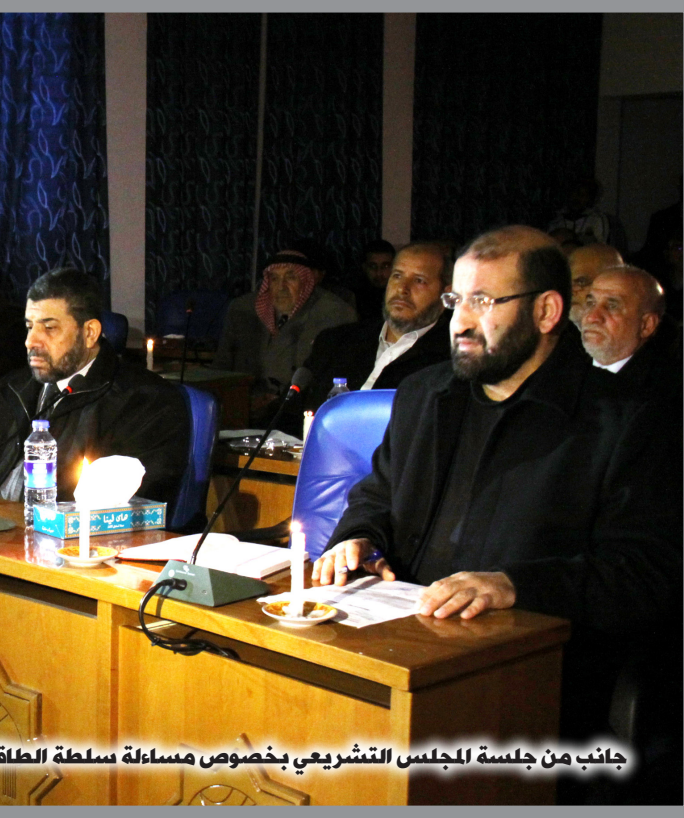
جانب من جلسة المجلس التشريعي بخصوص مساءلة سلطة الطاقة

سلطة الطاقة في استنزاف المخزون من المحطة، وحتى يوم الثلاثاء ٢٠١٢/٢/١٤ تم استنزاف كامل المخزون وأعلن عن إطفاء المحطة. وأضاف: "الآن متوفر لدينا ١٣٧ ميغا فقط يتم توزيعها على المحافظات ضمن جداول ثابتة على المواطنين".