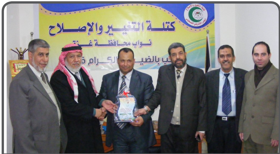
وفد من مديرية التربية والتعليم غرب غزة يهدي نواب غزة درعا تكريما لزيارتهم مكتب النواب بالمحافظة

بدورها قامت رئاسة المجلس بإجراء الاتصالات والمراسلات اللازمة مع الجهات المختصة، حيث تلقت ردودا بشأن غالبية الشكاوى، كما تم الاتصال مع مقدمي الشكاوى وإخبارهم بالحلول المقترحة لشكاوهم، وكان من أبرز إنجازات العمل خلال هذه الفترة تأمين فرص عمل مؤقتة لعدد من العاطلين عن العمل، وحل المشاكل بين المواطنين والهيئات المحلية وكذلك مع النيابة والقضاء. أما بشأن المساعدات المالية للتحويلات المرضية وأصحاب الأوضاع الصعبة فقد تم التواصل مع لجنة المساعدات الحكومية بمجلس الوزراء حيث تم صرف مساعدات مالية نقدية للبعض، وجاري العمل لمتابعة الحالات المتبقية. من جانبه أعرب بحر عن رضاه التام عن منظومة العمل في إطار