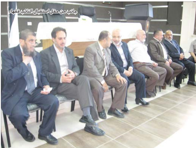
جانب من حفل استقبال النائب فقهاء

يذكر أن النائب فقهاء كان قد أفرج عنه مؤخرا من سجون الاحتلال بعد اعتقال دام 23 شهرا تخللها خوضه لإضراب عن الطعام استمر لمدة 60 يوما.