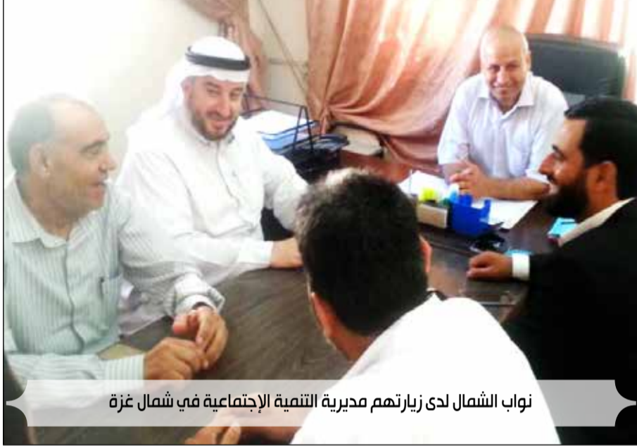
نواب الشمال لدى زيارتهم مديرية التنمية الإجتماعية في شمال غزة