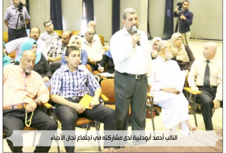
النائب أحمد أبو حلبية لدى مشاركته في اجتماع لجان الأحياء

جزء من المنطقة الواقعة غرب شارع النفق وضرورة توفير الخدمات الأساسية لأهالي المنطقة وتطوير الشوارع وتجديد شبكات المياه المنزلي من ناحية وشبكات الصرف الصحي من ناحية أخرى، مؤكداً على ضرورة انجاز هذه المشاريع في أسرع وقت ممكن لما لها من دور فاعل في خدمة المجتمع والمواطنين في حي المنارة.