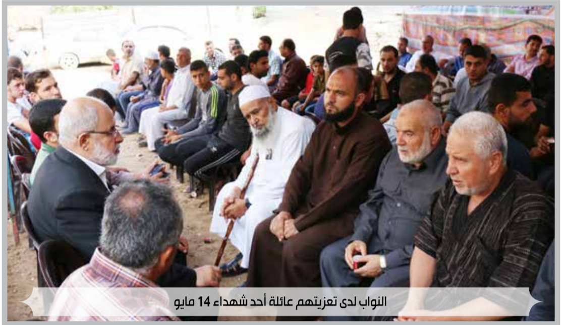
النواب لدى تعزيتهم عائلة أحد شهداء 14 مايو

الجحافل الهادرة التي ترابط بشكل يومي وسلمي وشعبي أمام الأسلاك الزائفة. وأكد أن صفقة القرن وكل المخططات والمؤامرات التي تستهدف النيل من حق العودة والقدس والمقدسات وتحاول سلب ومصادرة أرضنا الفلسطينية، سوف تفشل وتتحطم على صخرة ثبات وسمود شعبنا ومقاومته الباسلة، مؤكداً على قدسية حق العودة، ومشدداً على أنه لا يخضع مطلقاً للمساومة أو الابتزاز.