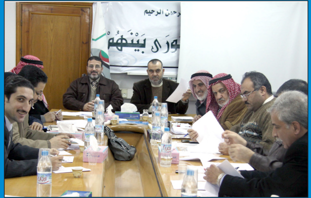
اللجنة القانونية بالتشريعي تعقد ورشة عمل لمناقشة مشروع قانون استثمار أملاك الدولة