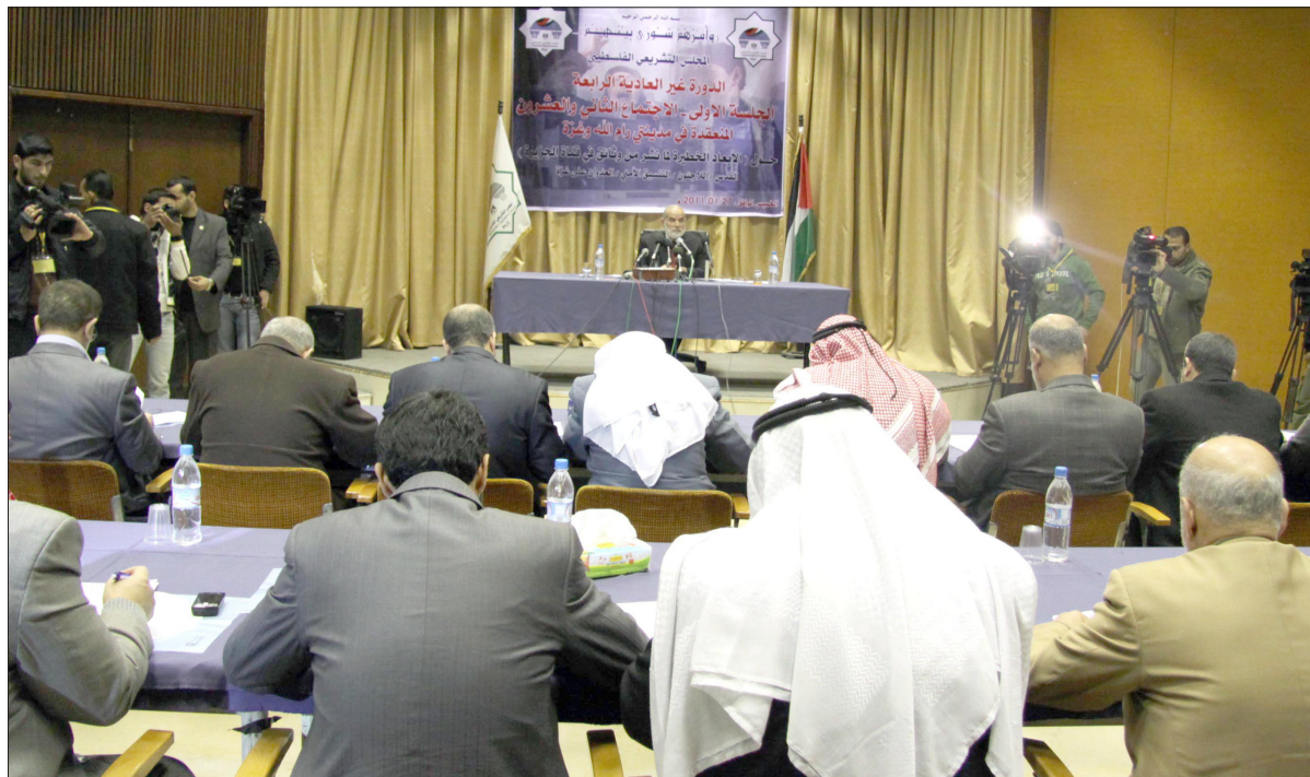
جانب من جلسة المجلس التشريعي التي انعقدت في مركز رشاد الشوا لمناقشة الأبعاد الخطيرة للوثائق التي كشفت عنها الجزيرة

تقرير اللجنة السياسية يدعو شعبنا لهبة غضب عارمة لإسقاط مشروع المفاوضات والتنازلات