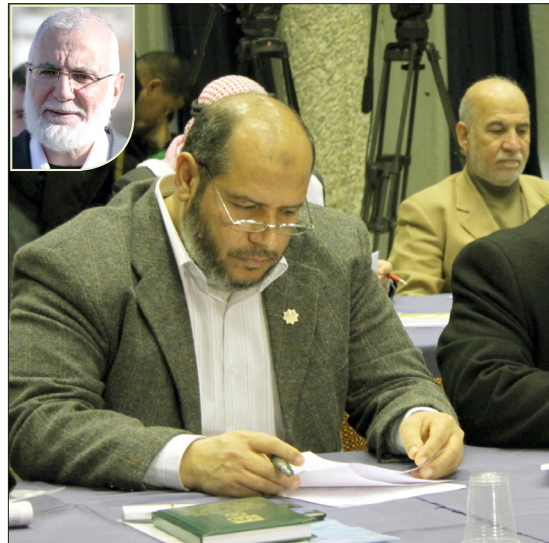
في سياق جلسة التشريعي حول الوثائق التي كشفت عنها الجزيرة

رابعاً: إن حركة فتح مطالبة بالكف عن الدفاع عن جرائم الفناض وإن ناطقيها وممثليها مطالبون بالكف عن التلاعب بالأنفاض والكلمات أو إنكار التنسيق والتعاون الأمني لأن الشواهد والوقائع والنصوص المكتوبة أصبحت ماثلة أمام كل الجماهير، فاتفاقية (أوسلو) لها ملاحق أمنية معروفة ومنصوص عليها، واتفاقية (واي ريفر) واتفاقية ميتشل واتفاقية (تينت) تنص على التنسيق الأمني لضرب المقاومة ووقف الانتفاضة، وخارطة الطريق التي ما يزال الطرف الفلسطيني في الضفة يستمد وجوده من تطبيق الشق الأمني منها، وكذلك قيادة الجنرال (دايتون) ومن بعده الجنرال (مولر) للأجهزة الأمنية الفلسطينية، والاعتقالات السياسية وتسليم المجاهدين للعدو الصهيوني والتباهي بذلك من قبل قادة الأجهزة، كل ذلك ربما لا تضيف الوثائق الكثير من الأدلة الدامغة عليه، وليس أمام حركة فتح إلا أن تنظف نفسها منه وتغسل عارها بعزل هذا المفاوض المفرط وقادة التعاون الأمني الذين يذبحون أطفالنا ومجاهدينا، لأن هذا هو المدخل الحقيقي لمصالحة وطنية تقوم على التحلي بالثوابت بعد التخلي عن المفرطين والمتعاونين مع الاحتلال.