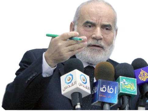
النائب / د. أحمد محمد بحر

دان د. أحمد بحر النائب الأول لرئيس المجلس التشريعي تفريط قيادة سلطة فتح بالحقوق والثوابت الوطنية وفق ما كشفت عنه قناة الجزيرة، مؤكداً أن الحرب على غزة جاءت بتحريض سلطوي مفضوح.