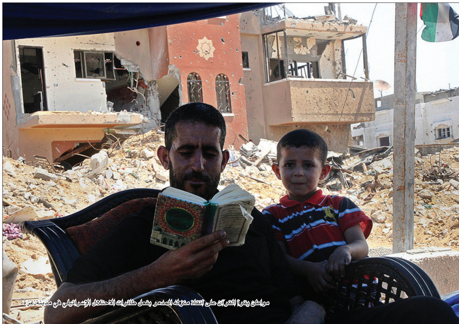
مواطن يغزل الغزل على آلة الغزل معزلة المدمر بفعل ظاهرات الاحتلال الإسرائيلي في مدينة غزة

أكدت رئاسة المجلس التشريعي الفلسطيني، أن مطالب المقاومة مقدسة ورفضها سيقود الى مواجهة طويلة المدى بدل تهدة طويلة المدى . وشددت الرئاسة في بيان أصدره المكتب الإعلامي للتشريعي، اليوم ، أن المصلحة الفلسطينية في استمرار المقاومة ورفض أي اتفاق هزيل لا يلبى طموحات شعبنا ، مؤكدة وجود اجماع شعبي وفصائلي على ذلك ورفض ما دون ذلك. وجددت مطالبتها للمقاومة المتمسكة بمطالبها وعدم الإستجابة للضغوط