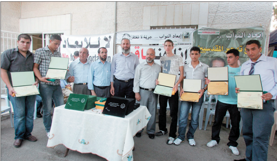
النواب المقدسيون يكرمون الطلبة المتفوقين في امتحانات الثانوية العامة

لم يكتف النواب المقدسيون المهددين بالإبعاد بملامسة فعاليات التضامن مع قضيتهم العادلة، بل انتقلوا خطوة إضافية إلى الأمام عبر العمل والمبادرة إلى القيام بأنشطة وطنية مختلفة.