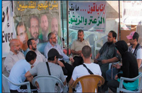
وفد من مسلمي بريطانيا يزور خيمة الاعتصام