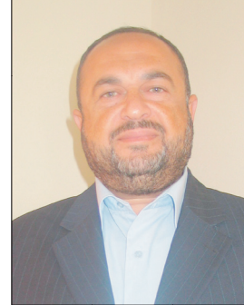
بقلم النائب / م. عبد الرحمن زيدان

(فوبيا هو مصطلح في علم النفس يعني الخوف والرعب من أشياء محددة كالارتفاعات أو السرعة مثلاً).