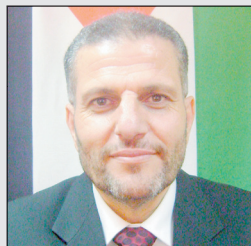
النائب د. محمود الرمحي

تكون قد تناست تضحيات الشعب وآهاته. وأكد الرمحي تصريحات حكومة الاحتلال ومستوليها حول العودة للبناء في المستوطنات