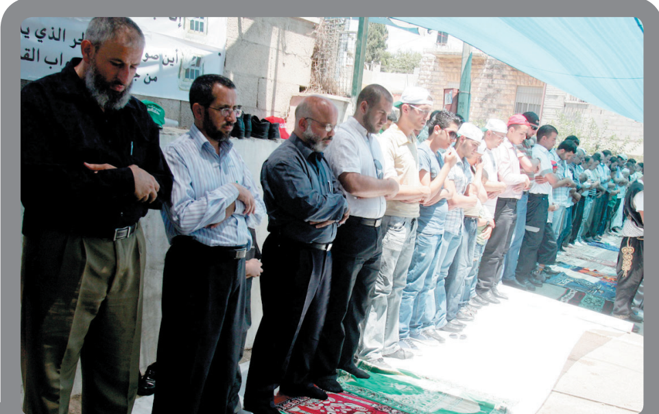
النواب المقدسيون وجماهير غفيرة من المقدسيين يؤدون صلاة الجمعة في خيمة الاعتصام

من جهتهم رحب النواب بهذه الزيارة وطلبوا من عريقات بذل كافة الجهود وعلى جميع المستويات لإلغاء قرار الإبعاد الذي يستهدف جميع