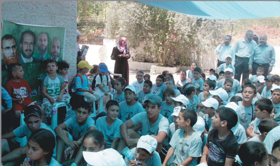
وفود طلابية مقدسية تؤم خيمة الاعتصام

كما أكد على ضرورة قيام وزير الخارجية في السلطة رياض المالكي بجمع القناصل المعتمدين