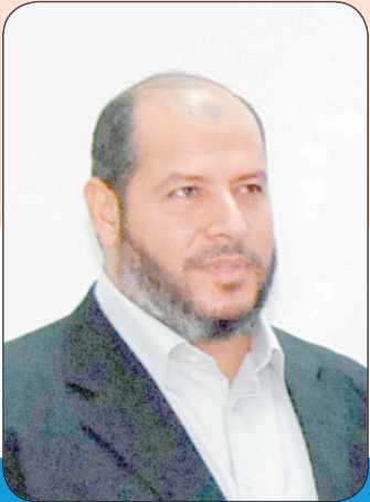
النائب د. خليل الحية

الداخلية ما يعيقها بالدرجة الأساسية هو الوضع الفلسطيني الفتحاوي تحديدا وهو يتمنى أن تنهض حركة حماس في برنامجهم رغم علمه أن برنامجهم وصل إلى طريق مسدود، ولكن هناك أصوات فتحاوية تريد المصالحة، والمصالحة تصطدم بالفيتو الأمريكي والفيتو الإقليمي والرضوخ الفتحاوي، ومصر لن تستطيع أن تقول لأمريكا لا رغم كونها رغبة بالمصالحة.