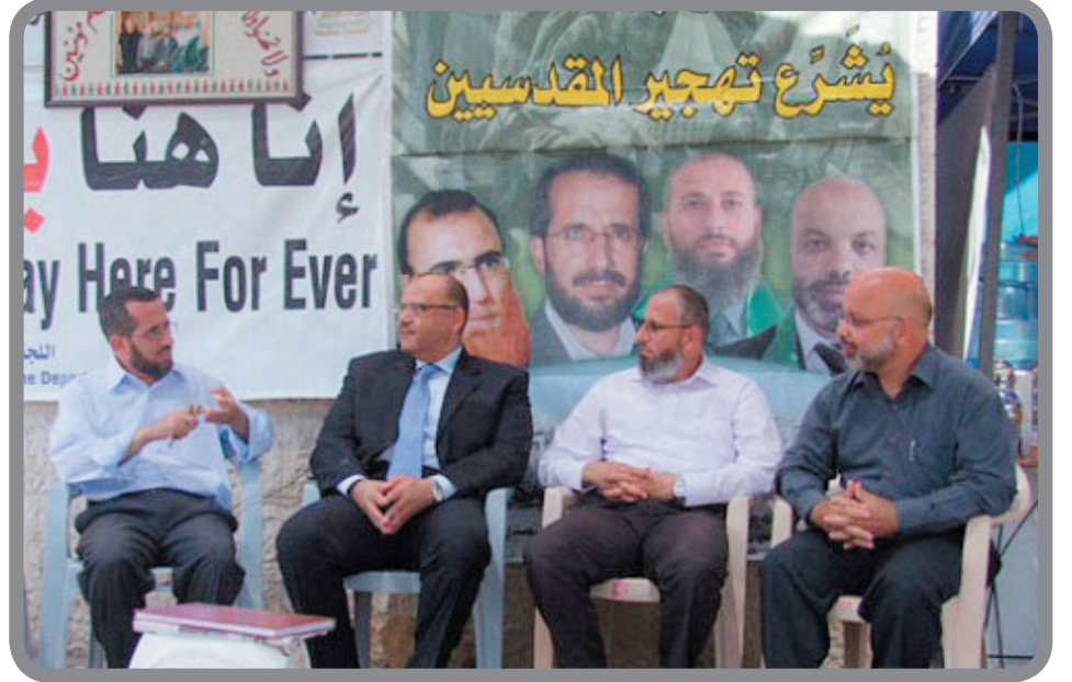
السفير المصري يزور خيمة اعتصام النواب للمرة الثانية خلال أقل من شهر