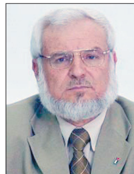
د. عزيز دويك

استنكر رئيس المجلس التشريعي د. عزيز دويك والنواب الإسلاميون في الضفة الغربية الفعلة الرعناء لما يسمى بـ"أجهزة أمن" سلطة رام الله في بيت لحم من خلال استدعائها لوزيرة شؤون المرأة السابقة أمل صيام.