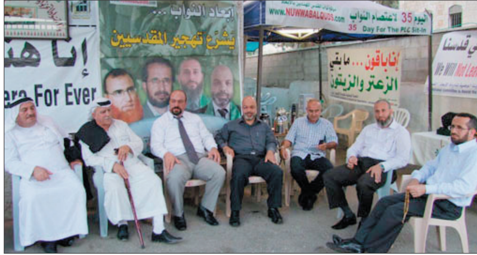
شخصيات مقدسية تؤم خيمة الاعتصام

تأثير أوروبي ضاغط وفاعل استطاع النواب أن يلمسوه من خلال مواقف عملية للأوروبيين الذين زاروا خيمة الاعتصام. كما نوه عطون بالاهتمام الإعلامي الذي يسلط الضوء على قضية القدس، والذي لم يكن موجوداً في السابق، مؤكداً أن خيمة الاعتصام استطاعت أن تسلط الضوء بقوة على قضية القدس والإبعاد.