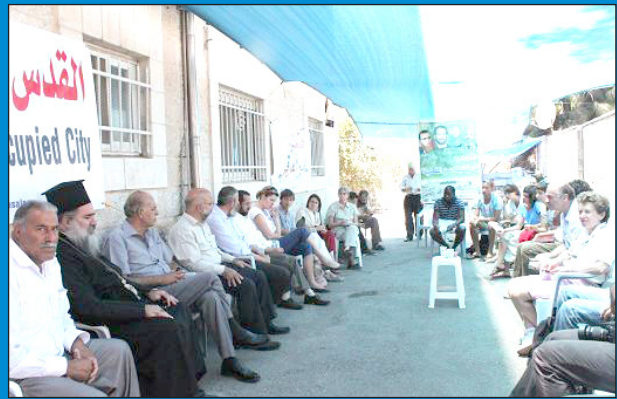
نواب القدس المهمدون بالإبعاد يستقبلون وفدا من رؤساء نقابات عمالية بريطانية في خيمة الاعتصام