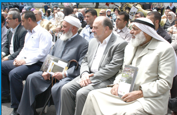
النواب الإسلاميون في نابلس يشاركون في احتفالية مرور ١٠٠ عام على إنشاء مدرسة الفاطمية