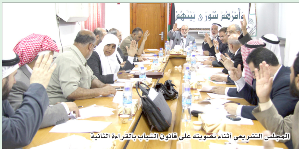
المجلس التشريعي أثناء تصويته على قانون الشباب بالقراءة الثانية

أقر المجلس التشريعي بالأغلبية المطلقة قانون الشباب الفلسطيني بالقراءة الثانية، وذلك خلال جلسة عقدها المجلس التشريعي في مقره بغزة اليوم.