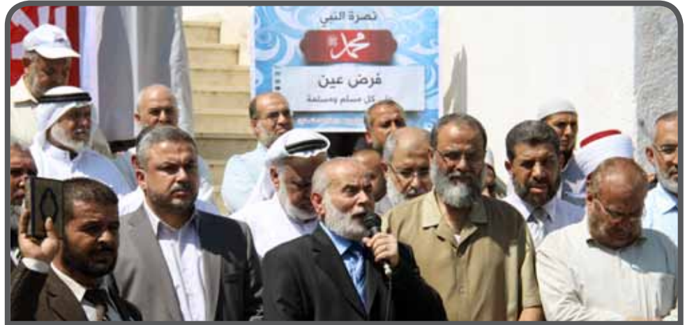
التشريعي ووزارة الأوقاف ورابطة علماء فلسطين ينظمون وقفة نصرة للرسول صلى الله عليه وسلم