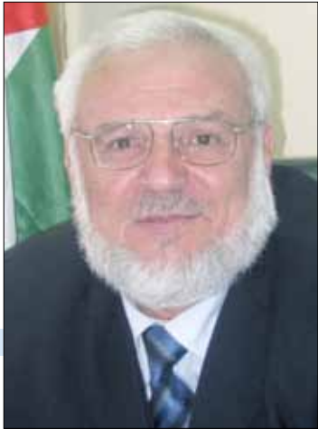
د. عزيز دويك

محاولة اتهام قوى بذاتها بتأجيج حراك الضفة بالية وغير مجدية.. وعلى البعض في السلطة إخلاء الساحة والرحيل