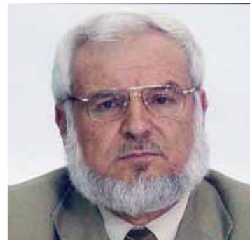
د. عزيز دويك

تنظر بعين عمية عن كل ما يفعله الاحتلال وتنظر بعين متفتحة على أي حركة يقوم بها أي مسلم يقوم بها دفاعاً عن نبيه.