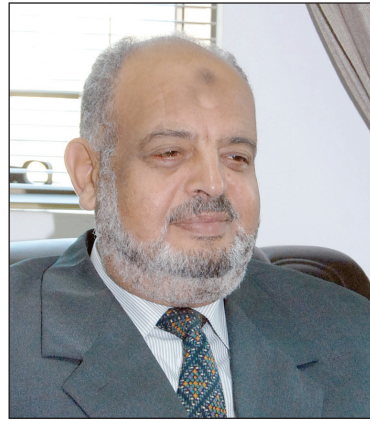
النائب خميس النجار

المسلمين وأحرار العالم بالدفاع عن أقدس مقدسات المسلمين في بلاد الشام وهو المسجد الأقصى المبارك.