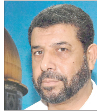
النائب أحمد أبو حلبية

المسلمين وأحرار العالم بالدفاع عن أقدس مقدسات المسلمين في بلاد الشام وهو المسجد الأقصى المبارك.